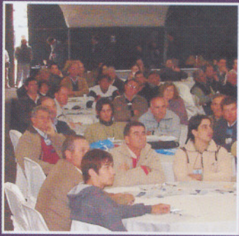
Jornada abierta en Mercoláctea

CITIL - Laboratorio Miguelete Sección "Biblioteca" Cas. Correo 157 1650 SAN MARTÍN (Bs. As.)