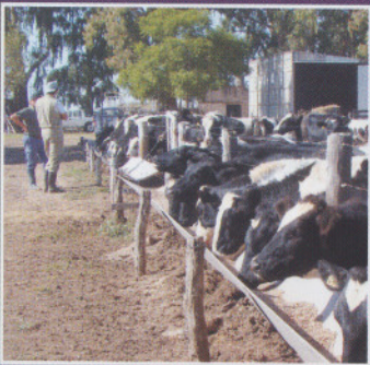
Diagnóstico y planificación