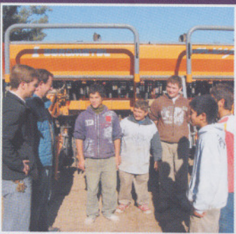
Formación humana y laboral