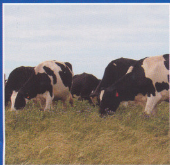
El tambo como empresa