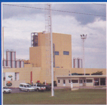
Inauguraciones en A.F.I.S.A.