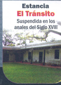
Estancia El Tránsito Suspendida en los anales del Siglo XVIII

El Grupo Chiavassa muestra cómo se gestiona un megatambo y los desafíos que se presentan.