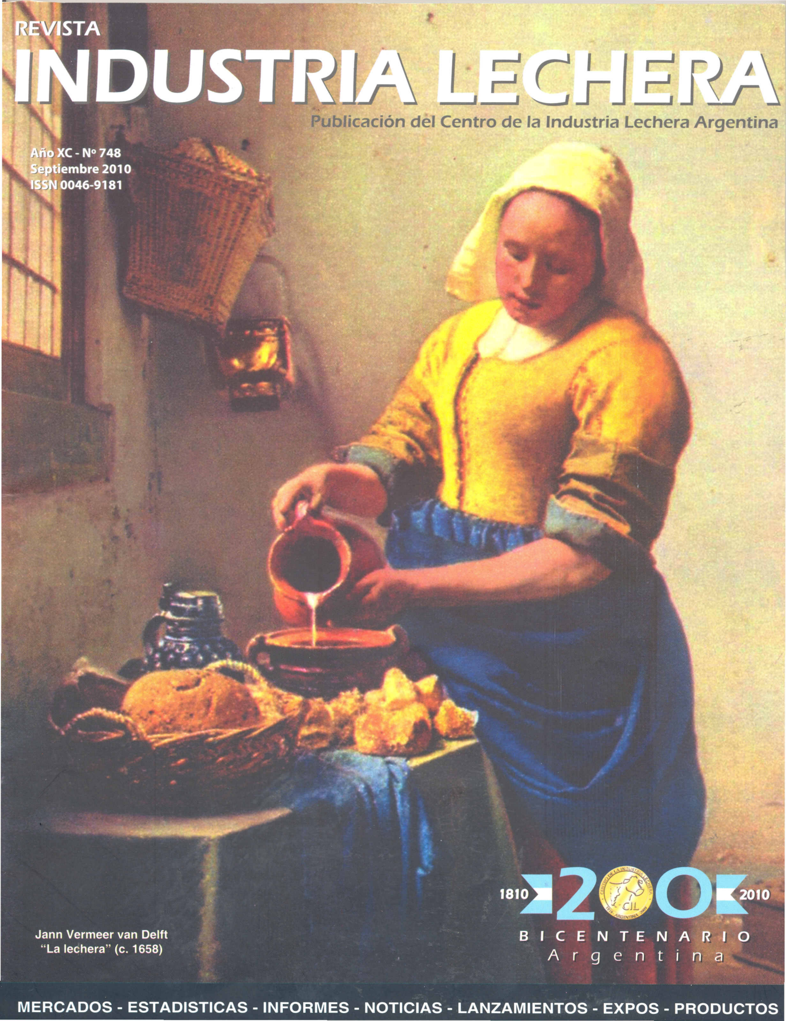
Jann Vermeer van Delft "La lechera" (c. 1658)

Año XC - N° 748 Septiembre 2010 ISSN 0046-9181