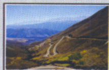
FOTO DE TAPA: Segundo Premio del Concurso de Fotografía "Obras de Ingeniería Civil", organizado por el Consejo Profesional de Ingeniería Civil y el Foto Club Buenos Aires. Título: "Zigsagueando", Autor: Lucio Eyra.

Empresa Editorial LEZGON S.R.L. - Coordinación Periodística: Arq. Gustavo Di Costa - Coordinación de Diseño, Arte y Diagramación: DG. Karina Vila y DG. Marina Sandez Dirección Comercial: Guillermo Zapata.