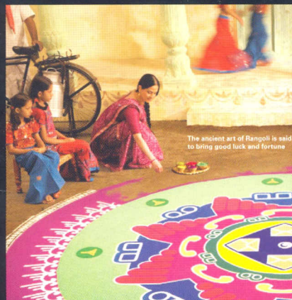
The ancient art of Rangoli is said to bring good luck and fortune