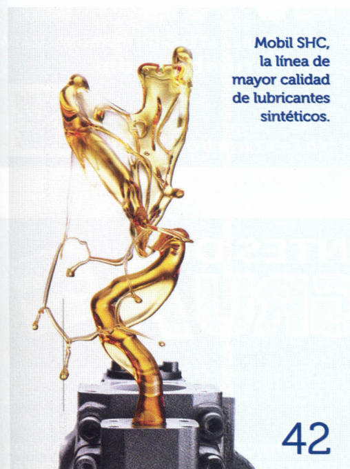
Mobil SHC, la línea de mayor calidad de lubricantes sintéticos.

Las decisiones fundamentadas dan prestigio a la gestión de mantenimiento.