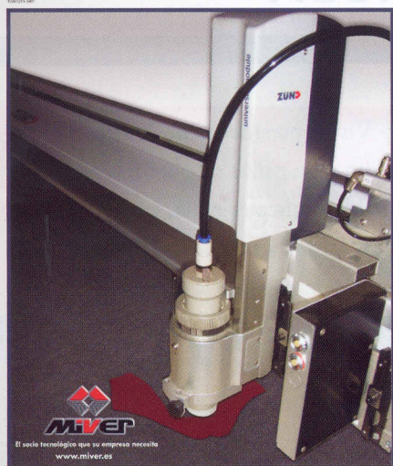
Portada / Cover: Comercial Miver