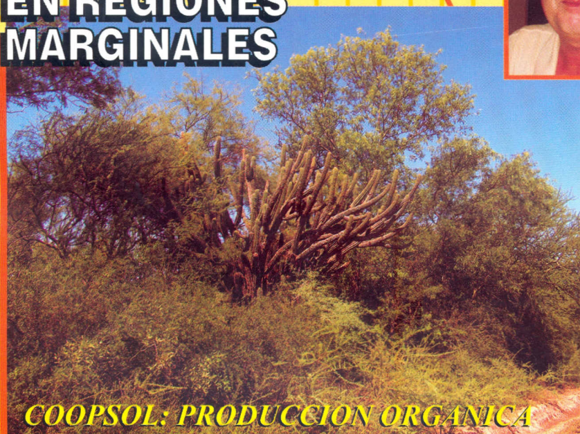
COOPSOL: PRODUCCION ORGANICA