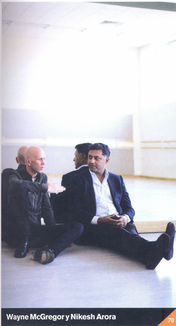
Wayne McGregor y Nikesh Arora