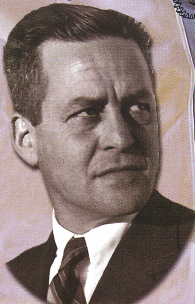
RAÚL SCALABRINI ORTIZ - 1898-1959

Ni devaluación, ni acuerdo estratégico con China: