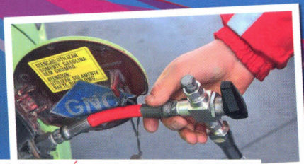
ECONOMÍA DE COMBUSTIBLE

Revista de la Asociación Estaciones de Servicio de la República Argentina www.notiaes.com