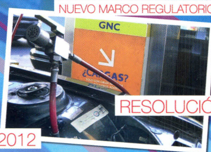
NUEVO MARCO REGULATORIO