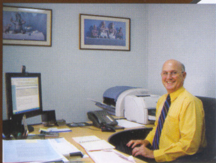
Por: Isidro Fernández-Aballí Maspons