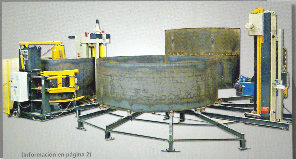
(Información en página 2)