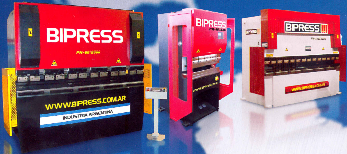
PLEGADORA HIDRÁULICA MOD. PH 60x2500