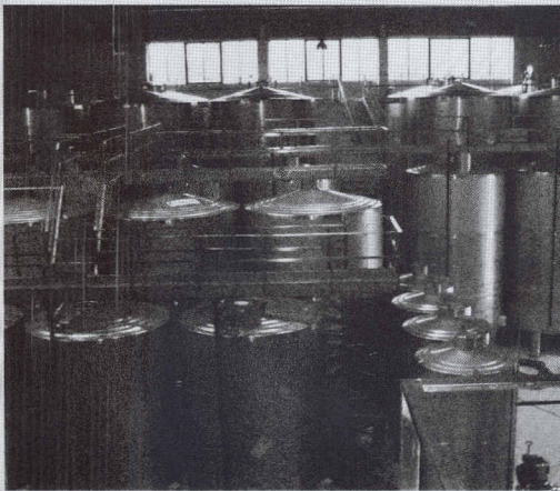
Actualidad Industrial, informe FISFE Página 18