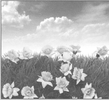
Los Plásticos, el Medio Ambiente y la Energía Página 3