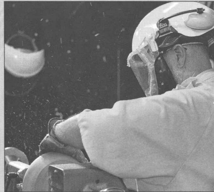
Higiene, Seguridad y Medio Ambiente Página 20