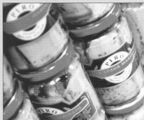
Cómo Exportar Alimentos Página 8