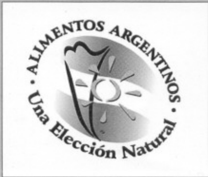
La Calidad en los Productos Alimenticios Página 12