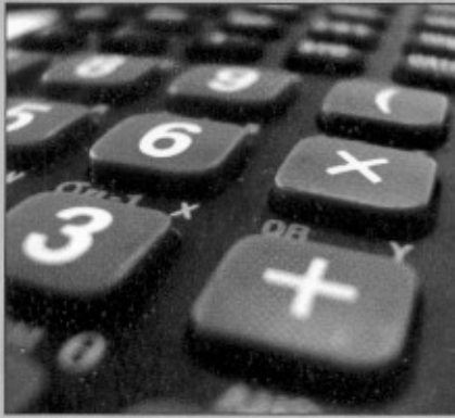
El Costo Económico o Costo de Oportunidad Página 6