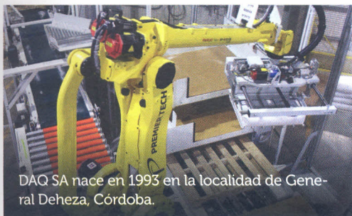
DAQ SA nace en 1993 en la localidad de General Deheza, Córdoba.

DAQ SA: soluciones integrales en equipamientos y servicios para la industria.