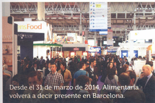
Desde el 31 de marzo de 2014, Alimentaria volverá a decir presente en Barcelona.

20. Alimentaria 2014 se centra en los mercados exteriores, la defensa de la innovación y la calidad del sector.